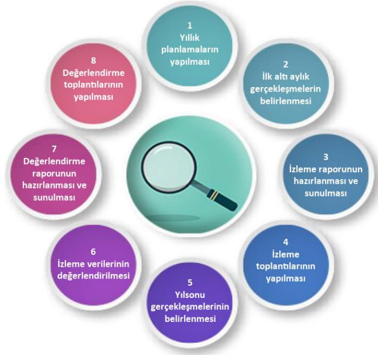
Şekil-4 İzleme ve Değerlendirme Süreci

İzleme ve değerlendirme sürecinin işleyişi ana hatları ile yukarıdaki şekilde özetlenmiştir.